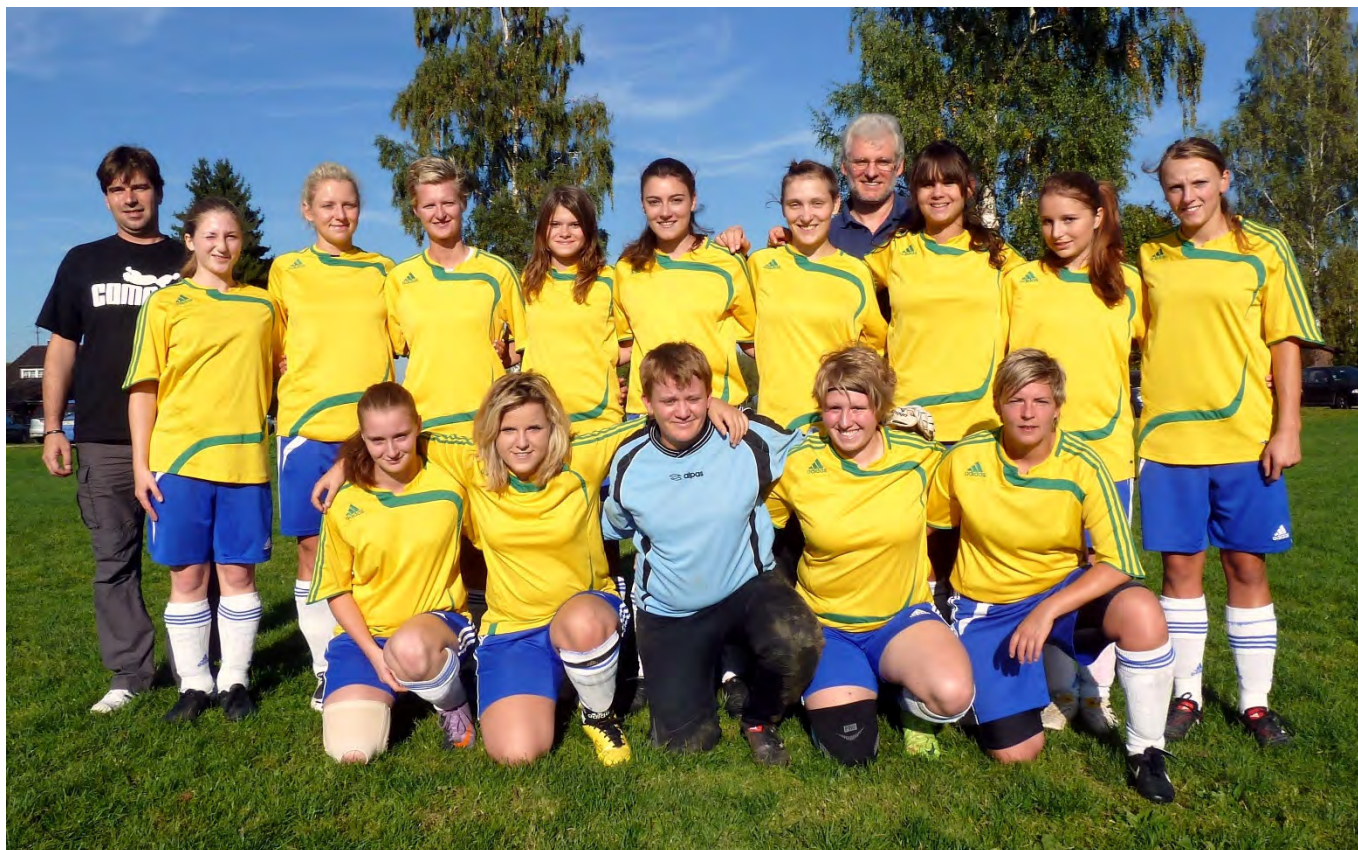
Unsere Damenmannschaft in der Saison 2010/2011