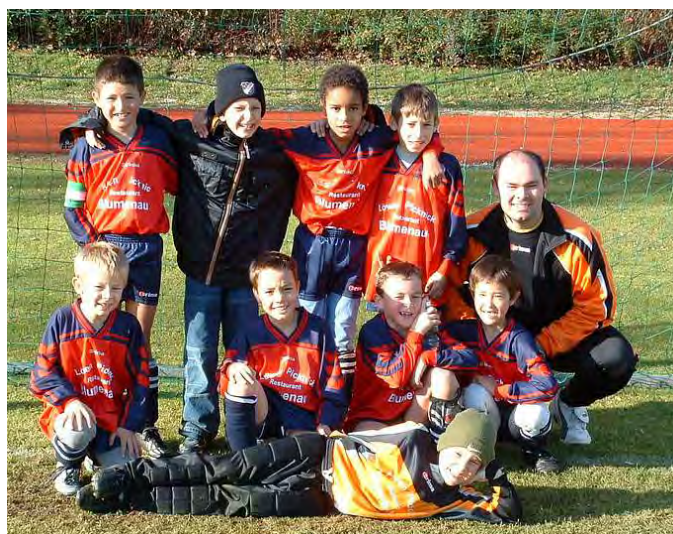
F-1 Junioren Saison 2003/2004