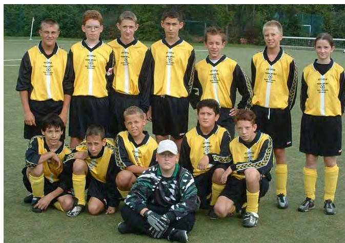
C-Junioren Saison 2003/2004