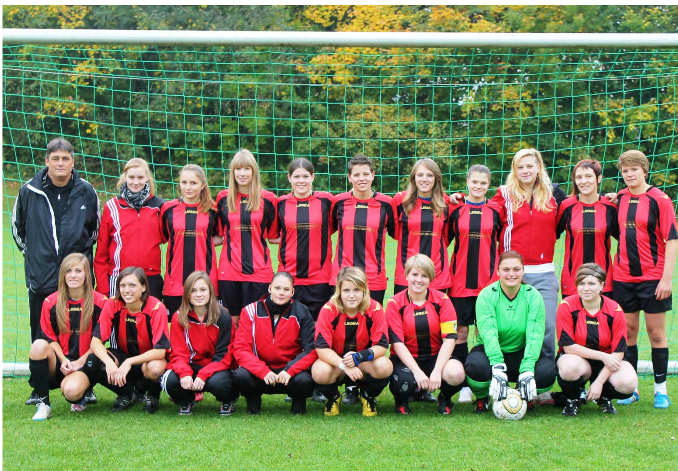
Unsere Damenmannschaft in der Saison 2012/2013