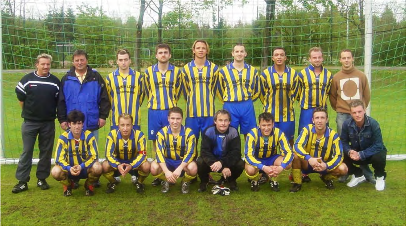
Unsere Erste Mannschaft in der Saison 2003/2004