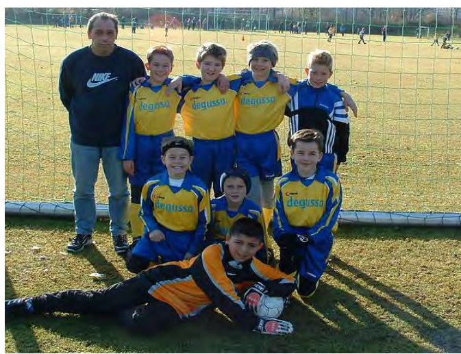
E-1 Junioren Saison 2003/2004