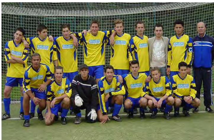
A-Junioren Saison 2003/2004