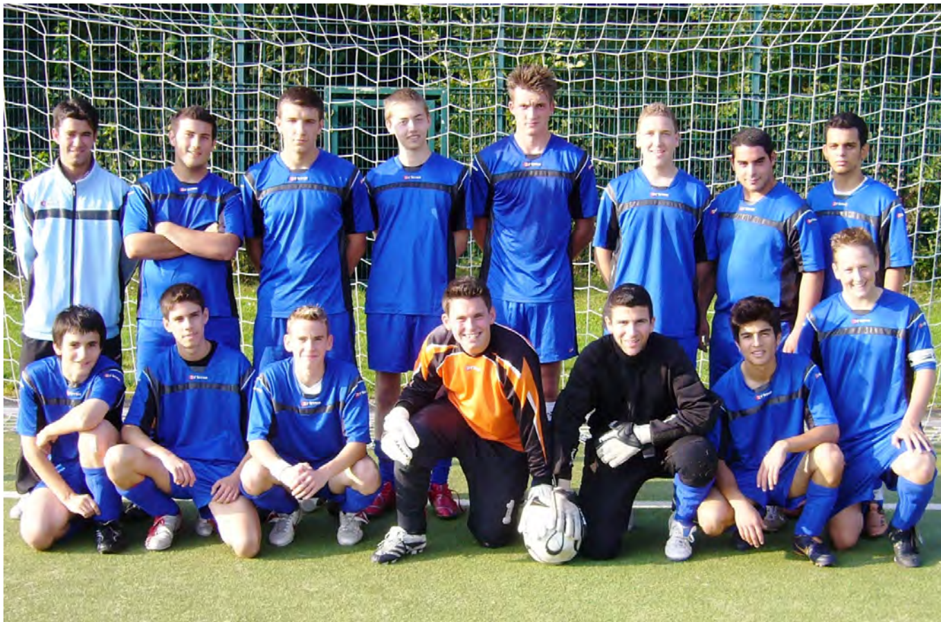
Unsere A-Junioren in der Saison 2004/2005