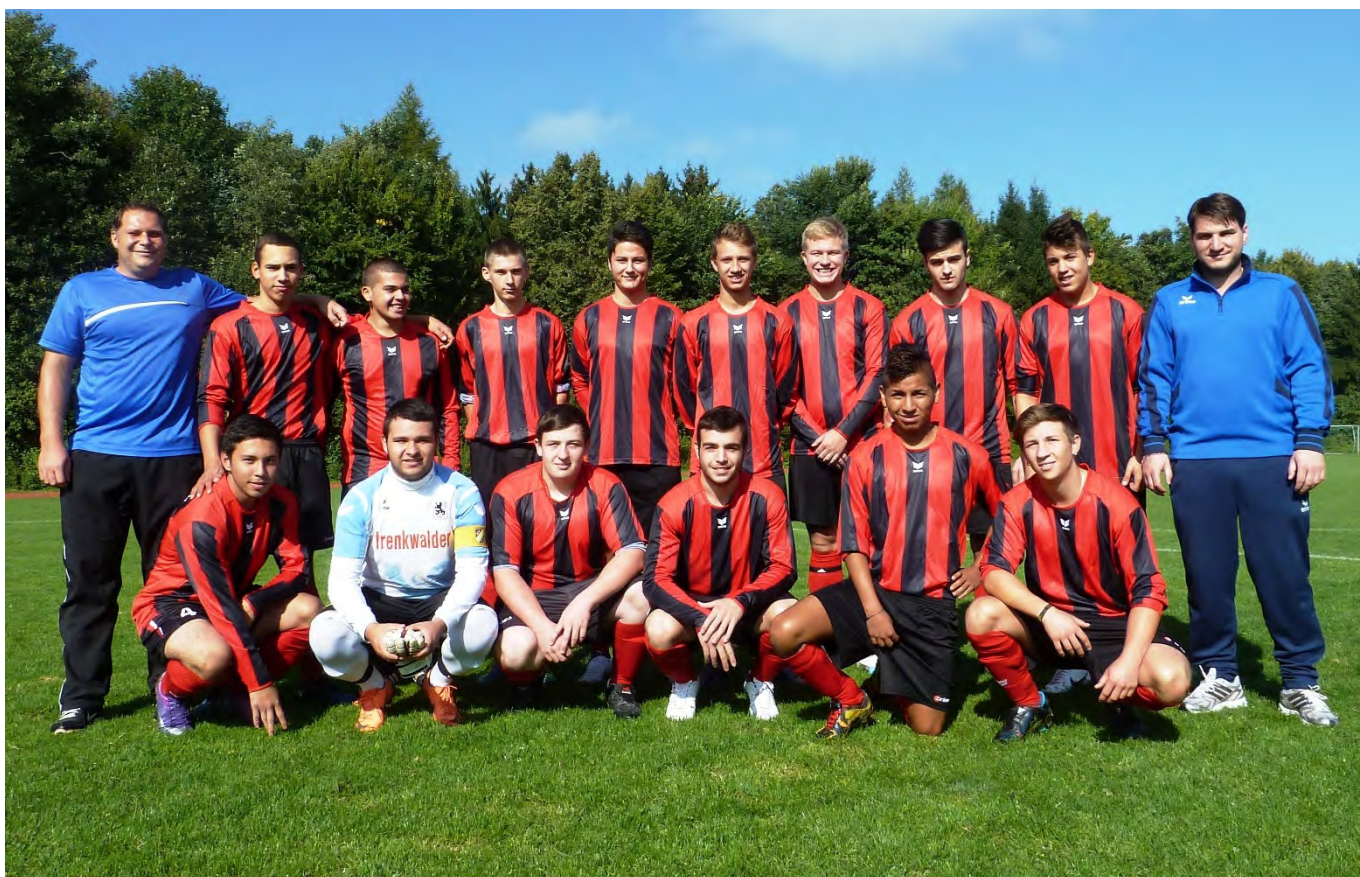
Unsere A-Junioren in der Saison 2012-2013