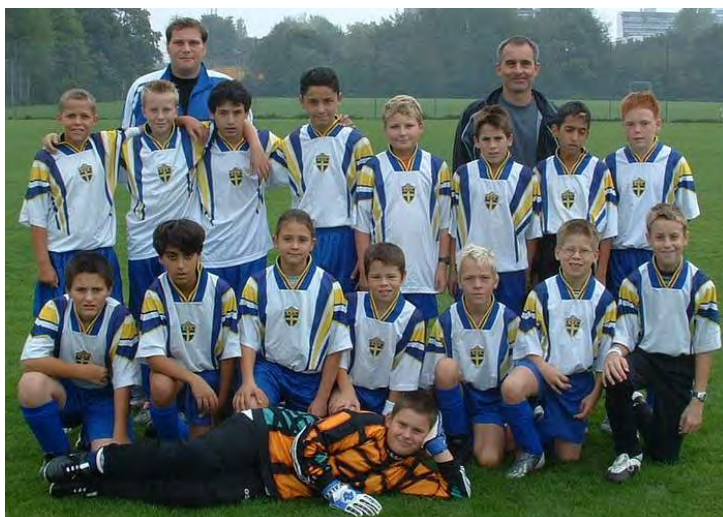
D-Junioren Saison 2003/2004