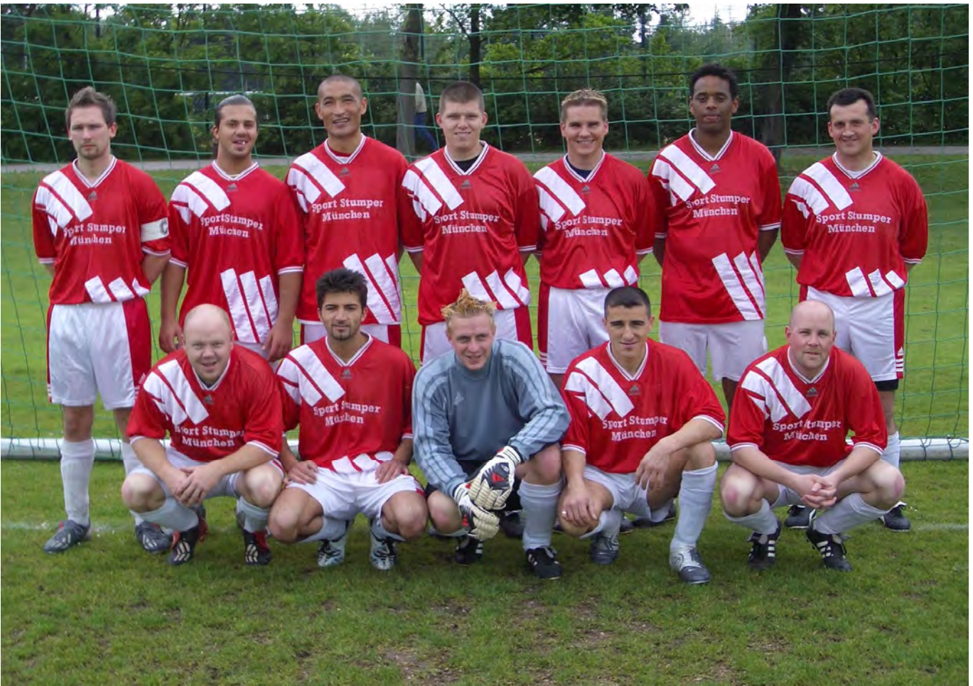
Unsere Zweite Mannschaft in der Saison 2003/2004