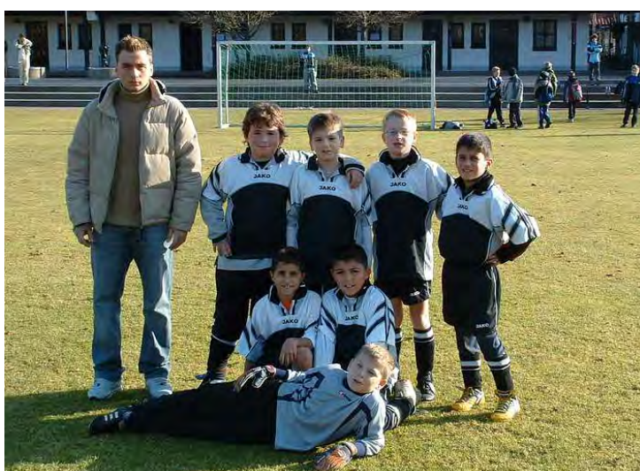
E-2 Junioren Saison 2003/2004